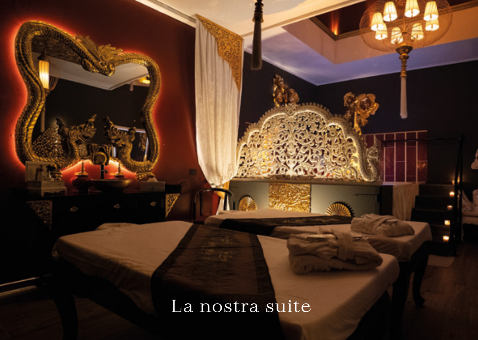
La nostra suite